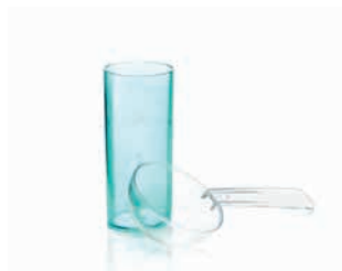
Набор мерников для 48-часовых альгинатов