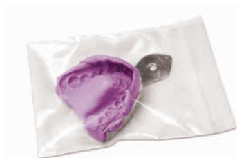
Пакет «Long Life», упаковка содержит 100 штук (герметично закрывающиеся пакеты для хранения оттисков)