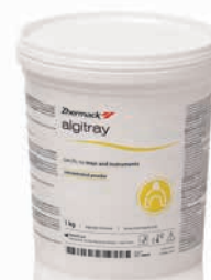
Algitrax 1 кг

Узнайте больше о других продуктах Zhermack, имеющих отношение к предварительному оттиску