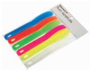
Флуоресцентные шпатели для альгинатов (6 штук)