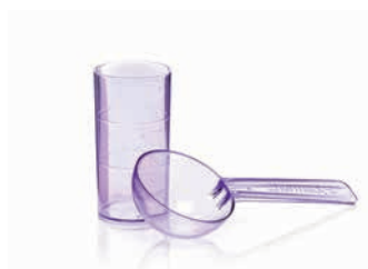
Набор мерников для 5-дневных альгинатов