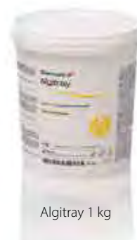
Algitrax 1 kg

Scopri di più sui prodotti correlati Zhermack per l'impronta preliminare