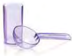
Set misurini per alginati fino a 5 giorni