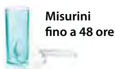
Misurini fino a 48 ore

Per ogni cucchiaino di polvere versare 1/3 di misurino d'acqua.