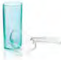
Set misurini per alginati fino a 48 ore