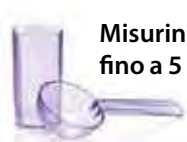
Misurini fino a 5 giorni