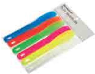
Spatole colorate fluo per alginati (6 pz)