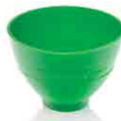
Tazza in gomma