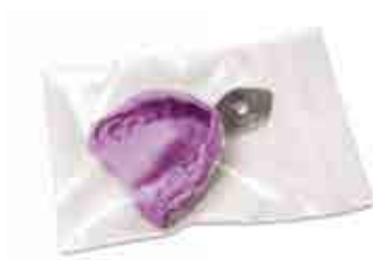
Long Life Bag, 1 conf. 100 pz (sacchetti con chiusura ermetica per conservare le impronte)