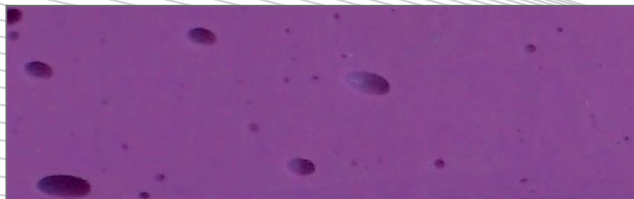
Ampliación de una mezcla manual de alginato