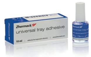
Flacone da 10 ml