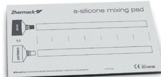
Mixing pad (12 fogli)