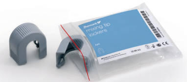
Blocca puntale (x2)