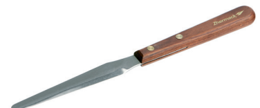
Spatola per siliconi