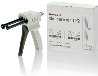
D2 Dispenser 1:1