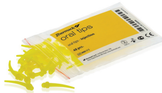
Puntali intraorali gialli (x48)